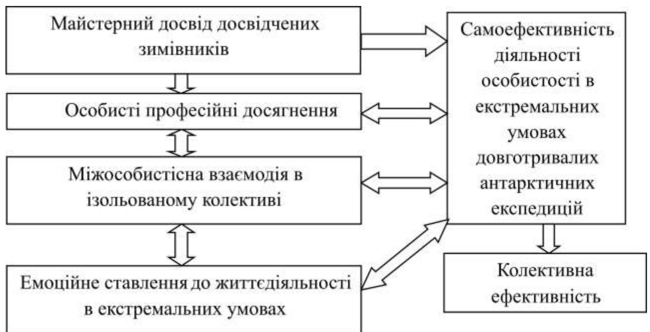
Рис. 2. Джерела впливу та взаємовпливу на зміну самоефективності особистості в особливих умовах життєдіяльності

Ефективно діюча особистість у професійній, побутовій та емоційних сферах формує ефективну міжособистісну взаємодію з колегами і, навпаки, ефективна взаємодія є джерелом зростання самоефективності особистості в замкненому колективі.