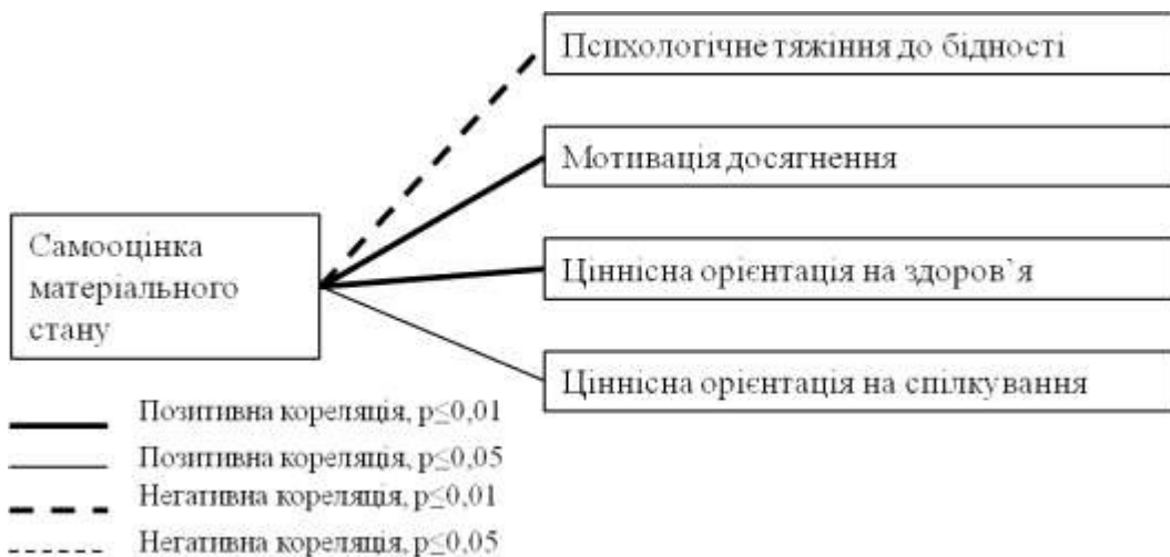
Рис. 4. Кореляційні зв'язки між самооцінкою матеріального стану та соціально-психологічними параметрами досліджуваної вибіркової сукупності

Аналіз статистичного зв'язку між самооцінкою власного матеріального стану та досліджуваними соціально-психологічними характеристиками показав виявив наявність кореляційного зв'язку між самооцінкою матеріального добробуту та такими показниками як психологічне тяжіння до бідності ( -0,245, p \leq 0,01 ), мотивація досягнення ( 0,173, p \leq 0,01 ), ціннісна орієнтація на спілкування ( 0,170, p \leq 0,05 ) та здоров'я ( 0,144, p \leq 0,01 ), кореляційні зв'язки схематично представлено на рис. 4.