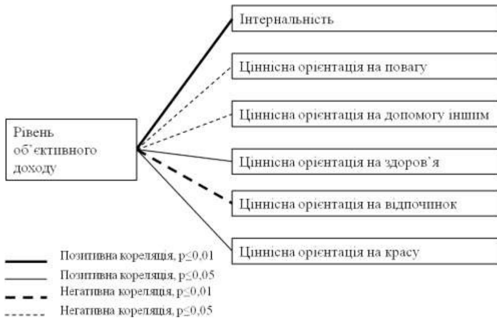
Рис. 3. Кореляційні зв'язки між рівнем об'єктивного доходу та соціально-психологічними параметрами

Отримані результати свідчать про те, що зі зниженням рівня добробуту знижується і схильність до інтернальності, як здатності покладати відповідальність за своє життя і результати власних зусиль виключно на себе, без очікування зовнішньої допомоги та без звинувачення зовнішніх обставин. В той же час, зі зниженням рівня матеріального добробуту зростає схильність до зовнішнього локусу контролю (екстернальності), який проявляється у тенденції звинувачувати у власних негараздах зовнішні обставини.