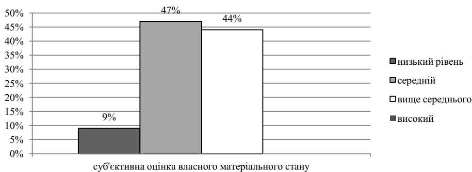
Рис. 2. Розподіл вибіркової сукупності за суб'єктивною самооцінкою рівня свого матеріального становища

За суб'єктивною самооцінкою рівня свого матеріального становища, 30 осіб (9%) оцінили його як низький; 154 особи (47%) – як середній; 143 особи (44%) – вище за середній; рівень матеріального добробуту як високий не оцінив ані один із досліджуваних (0%) (див. рис. 2).