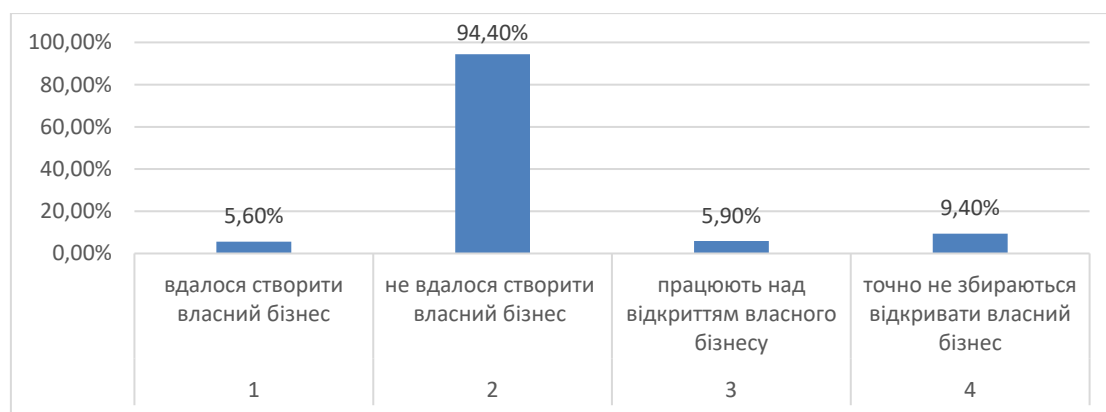
Рис. 2. Відкриття власного бізнесу респондентами (%)

Таблиця 6 відображає стан працевлаштування респондентів у нових країнах проживання.